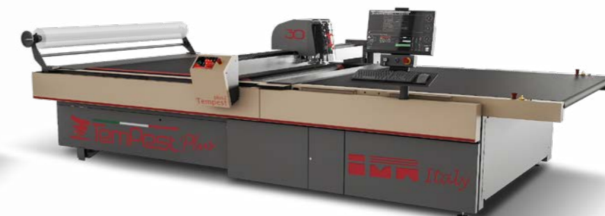
Tempest Plus2 921